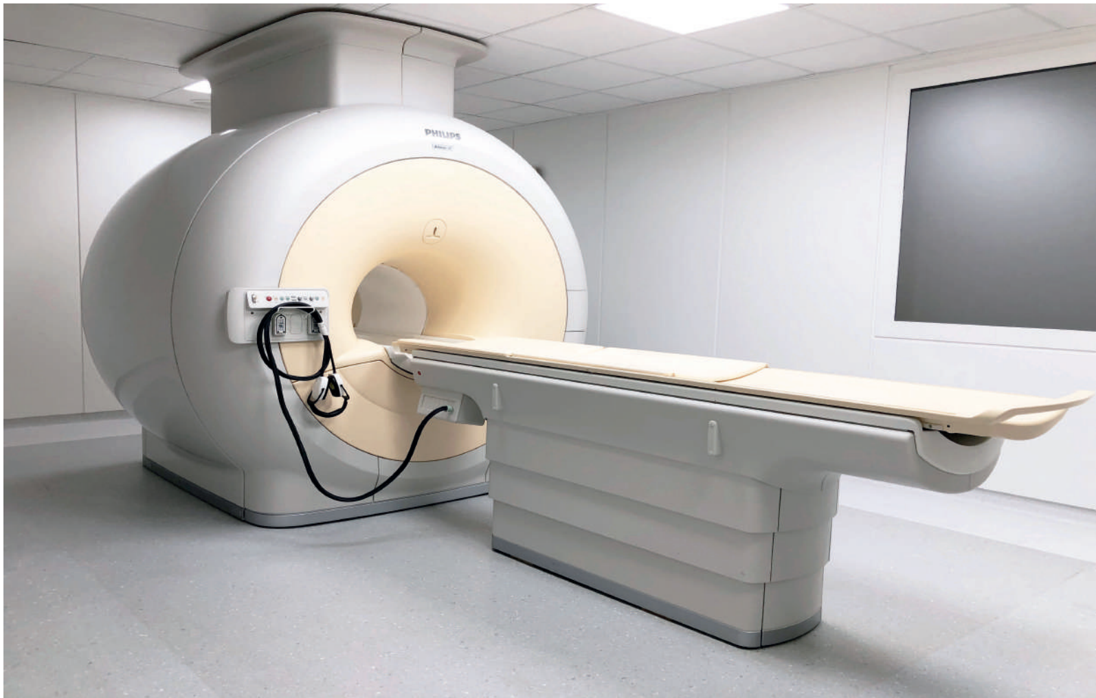
Philips 1.5 Tesla MRI