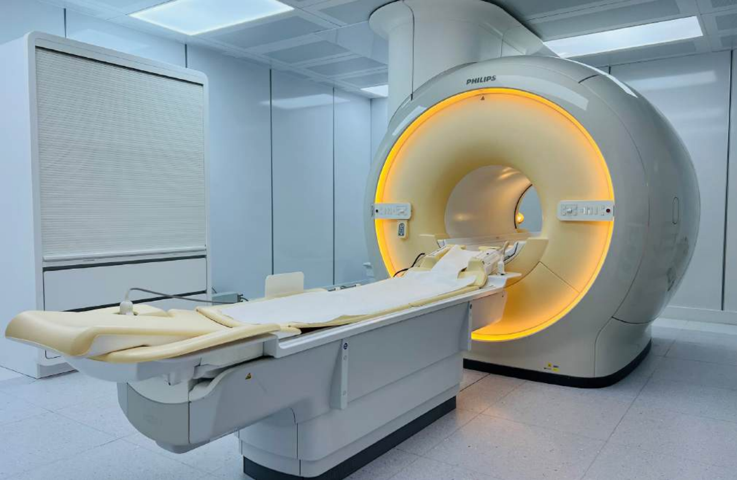
Philips 3.0 Tesla MRI