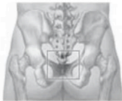
staartbeen (os coccygis)

Uw pijnklachten zijn gelokaliseerd rond het staartbeentje, waardoor zitten op een harde ondergrond erg pijnlijk is. Ook is fietsen vaak onmogelijk.